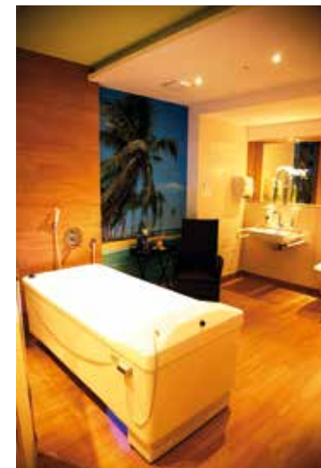
Das neue Wohlfühlbad mit mediterranem Flair lädt zur Entspannung in angenehmer Atmosphäre ein.